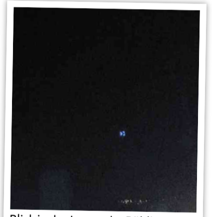
Blick in das Innere der Böblinger Kanalisation (bei Nacht).

Seltsamerweise gelten Abwassersatzungen als trockenes Thema und werden deswegen zu unrecht als Kellerkinder der Kommunalpolitik behandelt. Dabei sind sie eine Quelle wichtiger demokratischer Entscheidungen. Wie allseits bekannt, verschwinden Millionen Euro an Steuergeldern jährlich in dunklen Kanälen, und das sind Ausgaben, die weder gedeckelt sind, noch sonst wie aufgefangen werden. Natürlich hat das Thema wenig Sogwirkung und verdunstet leicht in den Küchen der Kommunalpolitik oder zerfällt im steten Wechsel der Schlagzeilen, und das sogar auch, wenn man es als Journalist ungefiltert in die entsprechenden Artikel gießt. Deswegen sollten die Medienleute dem Zeitgeist entsprechend eine Veränderung einleiten und sich von der althergebrachten trockenen Berichterstattung lösen. Vor allem im Hinblick auf junge Leute wird schnell klar: Um die Abwassersatzung angemessen rüber zu bringen, wäre eine Verfilmung hilfreich. Natürlich kein klassisches Fernsehspiel im Vorabendprogramm. Nein, man bräuchte mindestens eine Netflix-Miniserie. Vier Teile könnte sie haben, die Arbeitstitel wären „Einlauf“, „Anlauf“, „Ablauf“, „Volllauf“ mit zugkräftigen Stars wie Hannah Schygulla oder Jan Georg Schütte.